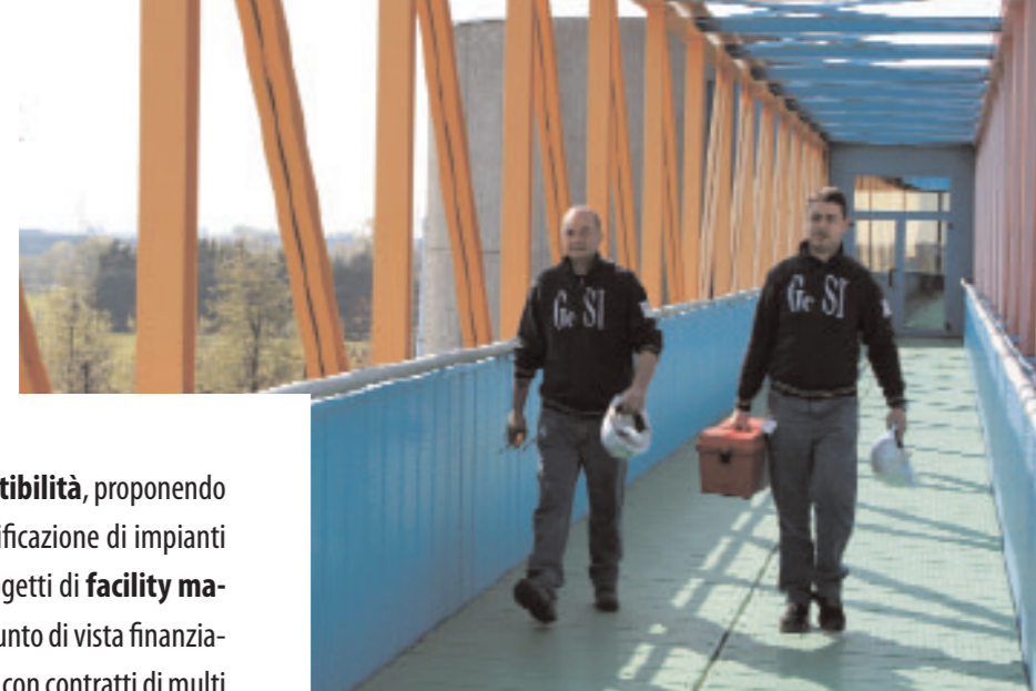
Progetto grafico: EB&B UNIB, Ingegneria della Comunicazione - Stampato: D'ADDETTE, It

GeSI elabora analisi tecnico-economiche e di fattibilità , proponendo soluzioni anche in project financing per la riqualificazione di impianti termici, elettrici e di condizionamento; sviluppa progetti di facility management e ne pianifica gli interventi, anche dal punto di vista finanziario, assicurando il raggiungimento dei risultati attesi con contratti di multi service o global service. GeSI utilizza le migliori tecnologie presenti sul mercato in quanto garanzia di efficacia nel tempo dei rendimenti e delle prestazioni previste, con ricerca continua di soluzioni innovative che migliorino le performances e consentano contenimento dei consumi, risparmio energetico e minor impatto ambientale.